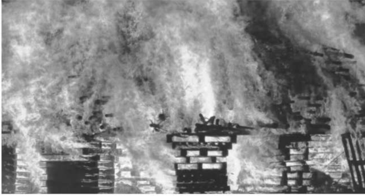
रायगढ़ के पीपे (बेरल) फट गए और आग ने भीषण रूप ले लिया। मृतकों की पहचान का प्रयास जारी है। साथ ही लापता लोगों के नाम और एड्रेस भी तलाश जा रहे हैं। वहीं, राष्ट्रीय राजधानी के बवाना औद्योगिक क्षेत्र में चूड़ी बनाने के कारखाने में शनिवार सुबह भीषण आग

लग गई। अधिकारियों ने यह जानकारी दी। दिल्ली अग्निशमन सेवा (डीएफएस) के अधिकारी ने बताया कि सुबह करीब 9 बजे बवाना के जी. ब्लॉक स्थित कारखाने में आग लगने की सूचना मिली। उन्होंने बताया कि आग पर काबू पाने के लिए दमकल की कम से कम 20 गाड़ियों की मौके पर भेजा गया और आग को बुझाने में करीब पांच घंटे लगे। अधिकारी ने बताया कि तीन मंजिला इमारत के भूतल पर शॉर्ट-सर्किट से आग लगने का संदेह है, जिसके बाद आग पहली और दूसरी मंजिल तक फैल गई। उन्होंने बताया कि आग लगने के बाद सभी श्रमिकों को सुरक्षित निकाल लिया गया था। उन्होंने बताया कि इस घटना में कोई हताहत नहीं हुआ है। अधिकारी ने बताया कि मुंबई से लगभग 170 किलोमीटर की दूरी पर स्थित रायगढ़ जिले की यह घटना है। यहां के एमआईडीसी महाड में दवा कंपनी ब्यू जेट हेल्थकेयर की फैक्ट्री में शुक्रवार सुबह 11 बजे आग लगी थी।