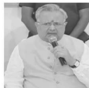
राज्य के पूर्व मुख्यमंत्री रमन सिंह छत्तीसगढ़ विधानसभा के स्पीकर होंगे, जबकि अरुण साव और विजय शर्मा को राज्य के उप-मुख्यमंत्री का पदभार दिया गया है।

नई दिल्ली: बीजेपी ने छत्तीसगढ़ के मुख्यमंत्री के नाम से साथ-साथ उपमुख्यमंत्री और स्पीकर के नाम की भी घोषणा कर दी, राज्य के पूर्व मुख्यमंत्री रमन सिंह छत्तीसगढ़ विधानसभा के स्पीकर होंगे, जबकि अरुण साव और विजय शर्मा को राज्य के उप-मुख्यमंत्री का पदभार दिया गया है, बता दें कि बीजेपी ने यूपी के बाद छत्तीसगढ़ में दो उपमुख्यमंत्री बनाए हैं, जबकि छत्तीसगढ़ में दो डिप्टी सीएम बनाने के ये पहला प्रयोग किया गया है, रविवार को राजधानी रायपुर में हुई बीजेपी विधायक दल की बैठक में विष्णुदेव साय नेता चुना गया और इसी के साथ राज्य के नए मुख्यमंत्री का नाम भी सामने आ गया, विष्णुदेव साय राज्य के मुख्यमंत्री, जबकि अरुण साव और विजय शर्मा छत्तीसगढ़ के उप-मुख्यमंत्री होंगे, विष्णुदेव साय ने राज्यपाल से की मुलाकात: विधायक दल के नेता चुने जाने के बाद विष्णुदेव साय राजभवन पहुंचे और राज्यपाल से मुलाकात की, इस दौरान उन्होंने सरकार बनाने का दावा भी पेश किया, बता दें कि छत्तीसगढ़ विधानसभा चुनाव के नतीजे चार राज्यों के साथ-साथ 3 दिसंबर को सामने आ गए थे, जिसमें राज्य की 90 विधानसभा सीटों में से बीजेपी ने 54 पर जीत दर्ज की, जबकि कांग्रेस को इस चुनाव में सिर्फ 35 सीटें ही मिली, पूर्व बहुमत मिलने के बाद मुख्यमंत्री के नाम को लेकर कवायद शुरू हुई, जिसके लिए बीजेपी ने तीनों राज्यों (राजस्थान, मध्य प्रदेश, छत्तीसगढ़) के लिए पर्यवेक्षक चुनकर भेजे, रविवार को छत्तीसगढ़ के मुख्यमंत्री का नाम तो सामने आ गया लेकिन मध्य