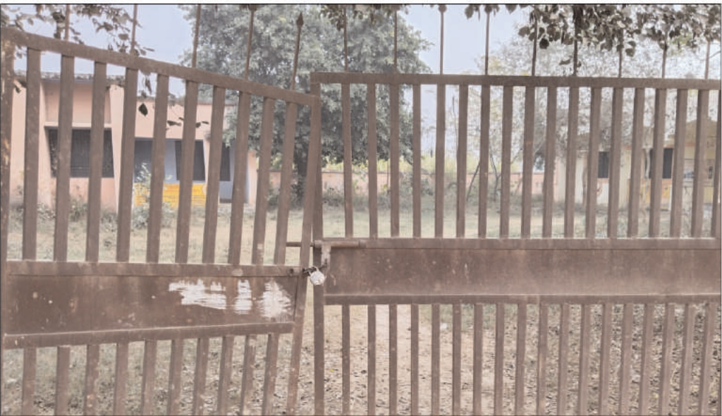
पीएचसी मटीपुरा में 10:22 पर लगा हुआ ताला।