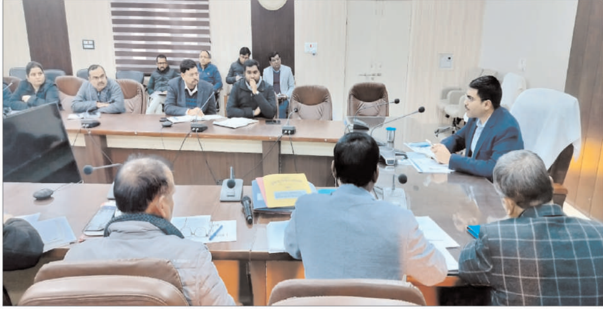
करते हुए कहा कि उप जिलाधिकारी एवं खंड विकास अधिकारी के माध्यम से अमर गौवंश संरक्षण में अपने कर्तव्यों के निर्वहन ना करने या आवश्यक सहयोग ना देने के लिए किसी भी सचिव या प्रधान के विरुद्ध आख्या प्राप्त होती है तो उसे बिना लंबित रखे हुए तत्काल कार्यवाही की जाए। जिलाधिकारी ने सहभागिता योजना को लेकर भी चर्चा की और संबंधित को निर्देशित करते हुए कहा कि अगर कोई व्यक्ति गौवंश रखना चाहता है तो उसको सहभागिता के अंतर्गत गौवंश दिए जाएं तथा उसका सत्यापन भी नियमित करवाया जाये।