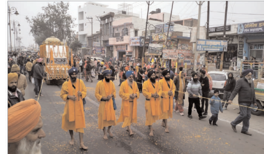
कीर्तन का आयोजन करवा गया। खास भोजन बनाते हैं और उस भोजन को सब में बांटते हैं, इसके अलावा जयंती के अवसर पर सिक्ख समाज के लोग सम्पूर्ण भारत विशेष परेड और जुलूस का आयोजन कर

गजरोला :- गुरु गोविन्द सिंह की जयंती पर नगर कीर्तन का आयोजन किया गुरु गोविन्द सिंह जयंती के अवसर पर भारत में रहने वाले सिक्ख समाज के लोग और वह सब लोग जो गुरु गोविन्द सिंह जी को मानते हैं और उन्हें याद करते हैं साथ ही खुद की और दूसरों की उन्नति के लिए प्रार्थना करते हैं, गुरु गोविन्द सिंह जी की द्वारा लिखी कविताओं को सुनते हैं और उनकी उपलब्धियों को लिख उनकी सराहना करते हैं, खास भोजन बनाते हैं और उस भोजन को सब में बांटते हैं, इसके अलावा जयंती के अवसर पर सिक्ख समाज के लोग सम्पूर्ण भारत विशेष परेड और जुलूस का आयोजन कर हर नगर की गलियों में बड़े ही धूमधाम और हवायुद्ध के साथ निकालते हैं इसी कड़ी में रविवार को गजरोला नगर में भी गुरु गोविन्द सिंह जयंती के अवसर पर