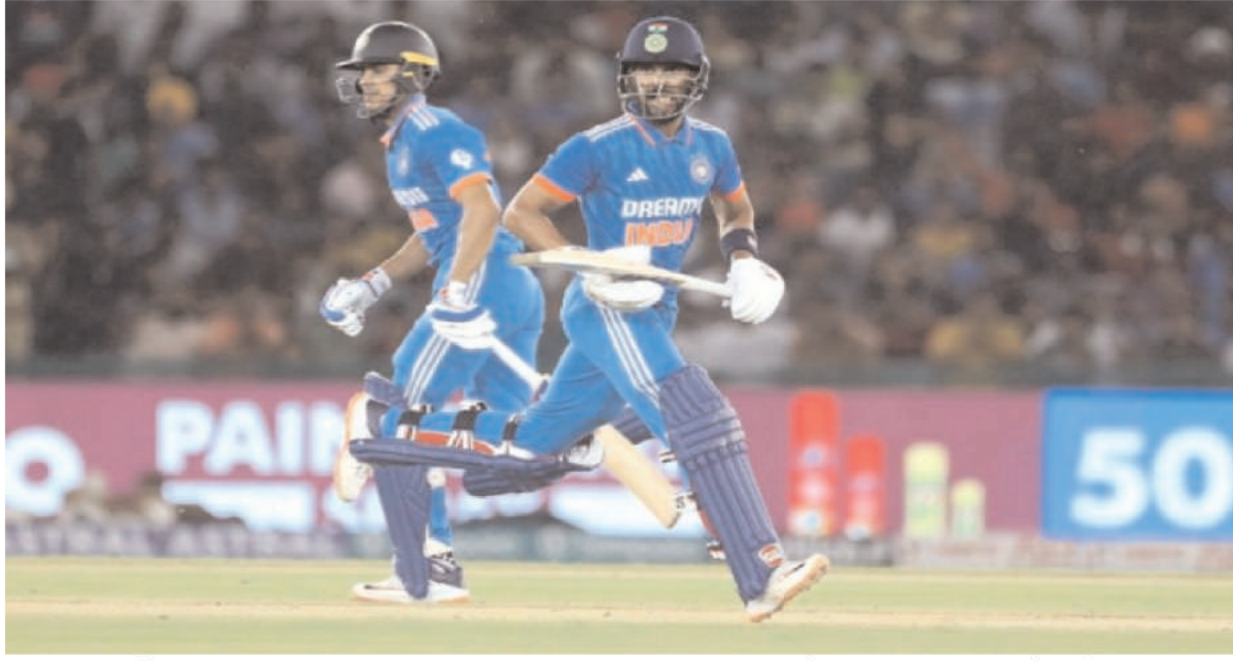
सूर्यकुमार यादव और हार्दिक पांड्या भी चोट के चलते अफगानिस्तान के खिलाफ टी20 सीरीज का हिस्सा नहीं होंगे.

अफगानिस्तान के खिलाफ खेले जाने वाली टी20 सीरीज के लिए भारतीय टीम के ओपनर रुतुराज गायकवाड़ उपलब्ध नहीं होंगे. ईएसपीएनक्रिकइंफो की रिपोर्ट के मुताबिक, रुतुराज गायकवाड़ फिलहाल उंगली में लगी चोट से जूझ रहे हैं. बता दें गायकवाड़ को पोर्ट एंजलिजवैथ में साउथ अफ्रीका के खिलाफ दूसरे वनडे के दौरान उंगली में चोट लग गई थी. इस चोट के कारण वह वनडे के बाद टेस्ट सीरीज से भी बाहर हो गए थे और अब वह अफगानिस्तान के खिलाफ टी20 सीरीज का भी हिस्सा नहीं होंगे.