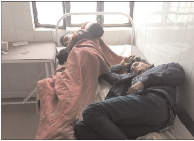
रह्रा सीएचसी में एक ही बेड पर दो मरीज।