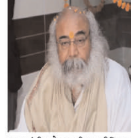
मुख्यमंत्री समेत सभी राजनीतिक दलों के राष्ट्रीय अध्यक्षों को आमंत्रित किया जा रहा है देश की प्रमुख नदियों का जल, 12 ज्योतिर्लिंगों की मिट्टी, सभी शांतिपीठों का प्रसाद और मिट्टी शिलान्यास के लिए मंगाई जा रही है। आने वाले समय में विश्व को शांति व सनातन का संदेश श्रीकल्कि धाम से ही जाएगा। श्रीराम मंदिर लंबे संघर्ष के बाद बना है और श्रीकल्कि धाम भी तमाम संघर्षों के बाद स्थापित हो रहा है। कल्कि धाम विश्व को नई ऊर्जा देगा।

संभल : एंचोड़ा कंवोह में श्रीकल्कि धाम के शिलान्यास की तैयारियां जोर-शोर से चल रही हैं। शिलान्यास कार्यक्रम में देशभर के साधु-संतों के साथ ही प्रधानमंत्री, मुख्यमंत्री समेत तमाम राजनैतिक दलों के राष्ट्रीय अध्यक्षों को आमंत्रित किया जाएगा। संभल में कल्कि धाम निर्माण का कार्य 19 फरवरी को शुरू होगा। कल्कि पीठाधीश्वर आचार्य प्रमोद कृष्णम ने शनिवार को कल्कि धाम में प्रेसवार्ता कर बताया कि भगवान का अंतिम अवतार श्रीकल्कि के रूप में संभल की धरती पर होगा। भगवान के अवतरण से पूर्व विश्व में पहला धाम संभल में श्रीकल्कि धाम स्थापित हो रहा है। कल्कि धाम के निर्माण कार्य के शुभारंभ के मौके पर देशभर के साधु-संत, शंकराचार्य, रामानुजाचार्य, रामानंदाचार्यों के साथ ही प्रधानमंत्री नरेंद्र मोदी, गुहमंजी, उत्तर प्रदेश के