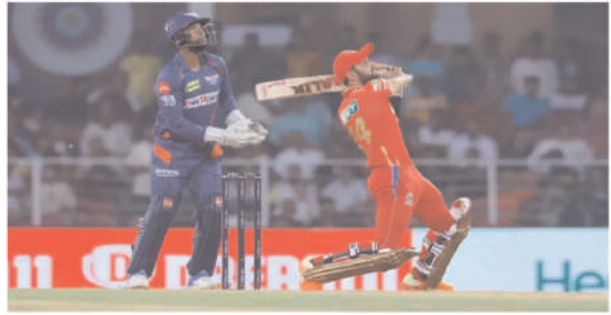
ऐलान कर दिया गया है। वनडे टीम में एक स्टार खिलाड़ी की वापसी हुई है। वहीं जिम्बाब्वे की टी20 टीम की कप्तान

जिम्बाब्वे क्रिकेट टीम को श्रीलंका दौरे पर तीन वनडे और तीन टी20 मैचों की सीरीज खेलनी है और इसके लिए वनडे और टी20 टीमों का अलग-अलग