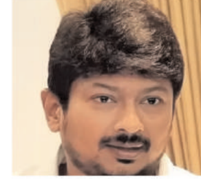
सामाजिक न्याय और समानता के खिलाफ है। उन्होंने कहा था, 'हम कोरोना, डेंगू और मच्छरों का विरोध नहीं कर सकते। हमें इन्हें खत्म करना होगा और इसी तरह सनातन को भी खत्म करना होगा।' उदयनिधि के बयानों के कारण पूरे देश में हंगामा खड़ा हो गया था। उन पर कई राज्यों में केस दर्ज किए गए थे। उदयनिधि स्टालिन ने हाल ही में कहा था कि सितंबर में सनातन धर्म पर उनके द्वारा की गई टिप्पणी में कुछ भी गलत नहीं था। उन्होंने संवाददाताओं से कहा, 'मैंने जो कहा, उसमें कुछ भी गलत नहीं था। हम कानूनी रूप से मामले का सामना करेंगे।

नई दिल्ली : सनातन धर्म के खिलाफ विवादित टिप्पणी करने वाले तमिलनाडु सीएम एमके स्टालिन के बेटे उदयनिधि स्टालिन की मुश्किलें बढ़ गई हैं। बेंगलुरु की कोर्ट ने उदयनिधि स्टालिन को सनातन पर दिए विवादित बयान के मामले में पेशी के लिए नोटिस जारी किया है। बता दें कि बीते साल उदयनिधि ने एक कार्यक्रम में सनातन धर्म की तुलना डेंगू और मलेरिया से की थी। उन्होंने इसे समाप्त करने की भी अपील की थी। इसके बाद देश में उदयनिधि की आलोचना की गई थी और उनपर मुकदमे दर्ज हुए थे। बेंगलुरु की 42वीं एसएम कोर्ट ने तमिलनाडु सरकार के मंत्री उदयनिधि स्टालिन को उनकी उस टिप्पणी पर 4 मार्च को पेश होने के लिए बुलाया है जिसमें उन्होंने कथित तौर पर सनातन धर्म की तुलना डेंगू और मलेरिया से की थी। इसके साथ ही कोर्ट की ओर से संबंधित कार्यक्रम का आयोजन करने वाले लोगों को भी समन जारी किया गया है। सनातन नाम संस्कृत से लिया गया है, जो