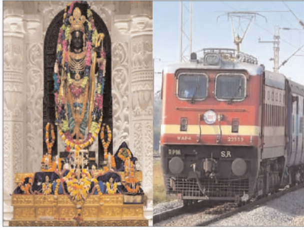
देशभर से करीब 1 हजार आस्था ट्रेन अयोध्या पहुंचेगी। देश के हर कोने से आस्था ट्रेन में करीब दस से बाह्र लाख श्रद्धालु अयोध्या पहुंचेंगे और राम मंदिर में बालक राम के दर्शन करेंगे। आस्था ट्रेन से आने वाले श्रद्धालुओं के रहने और

अयोध्या: 22 जनवरी को अयोध्या में रामलला की प्राण प्रतिष्ठा के बाद रामभक्तों का रामनगरी पहुंचना जारी है। हर रोज लाखों की संख्या में रामभक्त अयोध्या पहुंच रहे हैं। 23 जनवरी को तो रामलला के दर्शन के लिए इतने भक्त उमड़ पड़े कि प्रशासन को उन्हें काबू करने के लिए एड़ी-चोटी का जोर लगाना पड़ा। आस्था ट्रेनों का अयोध्या पहुंचना शुरू: अब इसके बाद रेलवे ने भी रामभक्तों के लिए स्पेशल ट्रेन चलाना शुरू कर दी है। इसी क्रम में सोमवार को राजस्थान से अयोध्या के लिए दो आस्था ट्रेन अयोध्या धाम जंक्शन पहुंचीं। इन दोनों ट्रेनों में हजारों रामभक्त राजस्थान से रामलला के दर्शन करने आये। बता दें कि राजस्थान से 5 आस्था ट्रेन अयोध्या आएंगी, जिसमें लगभग 7 हजार रामभक्त होंगे। वहीं फरवरी और मार्च में रेलवे