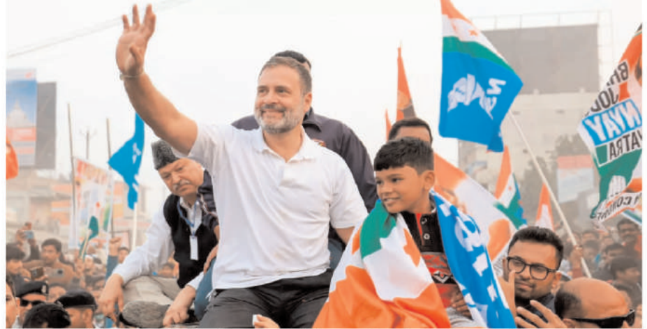
लाड़ा। इन चुनावों में हिमाचल प्रदेश में पार्टी को जीत मिली थी। वित्तीय वर्ष 2022-23 के लिए कांग्रेस को 452.30 करोड़ रुपये का चंदा मिला। कांग्रेस की भारत जोड़े न्याय यात्रा जारी बता दें कि कांग्रेस ने 'भारत जोड़े यात्रा' के मणिपुर से 14 जनवरी को 'भारत जोड़े न्याय यात्रा' शुरू की है। कांग्रेस की

कन्याकुमारी : कांग्रेस पार्टी ने 2022-23 में कन्याकुमारी से कश्मीर तक निकाली गयी अपनी 'भारत जोड़े यात्रा' पर कुल 71.80 करोड़ रुपये खर्च किये हैं। बता दें कि कांग्रेस की 'भारत जोड़े यात्रा' 145 दिनों तक चली थी और यह 30 जनवरी को श्रीनगर में समाप्त हुई थी। कांग्रेस की इस यात्रा पर औसतन हर दिन 49 लाख रुपये का खर्च आया था। बता दें कि कांग्रेस पार्टी द्वारा वित्तीय वर्ष 2022-23 के लिए निर्वाचन आयोग के पास दाखिल नवीनतम वार्षिक अंकेक्षण रिपोर्ट के अनुसार उसने 2022-23 में चुनाव-पूर्व सर्वेक्षणों पर 40,10,15,572 रुपये खर्च किए। कांग्रेस का चुनावी खर्च 192.5 करोड़ निर्वाचन आयोग के पास दाखिल इस रिपोर्ट के मुताबिक वित्तीय वर्ष 2022-23 में कांग्रेस पार्टी का चुनावी खर्च 192.5 करोड़ रुपये से अधिक था। अंकेक्षण की इस अवधि के दौरान कांग्रेस पार्टी ने 2022 में गुजरात और हिमाचल प्रदेश में जबकि 2023 की शुरुआत में त्रिपुरा, नागालैंड और मेघालय में चुनाव