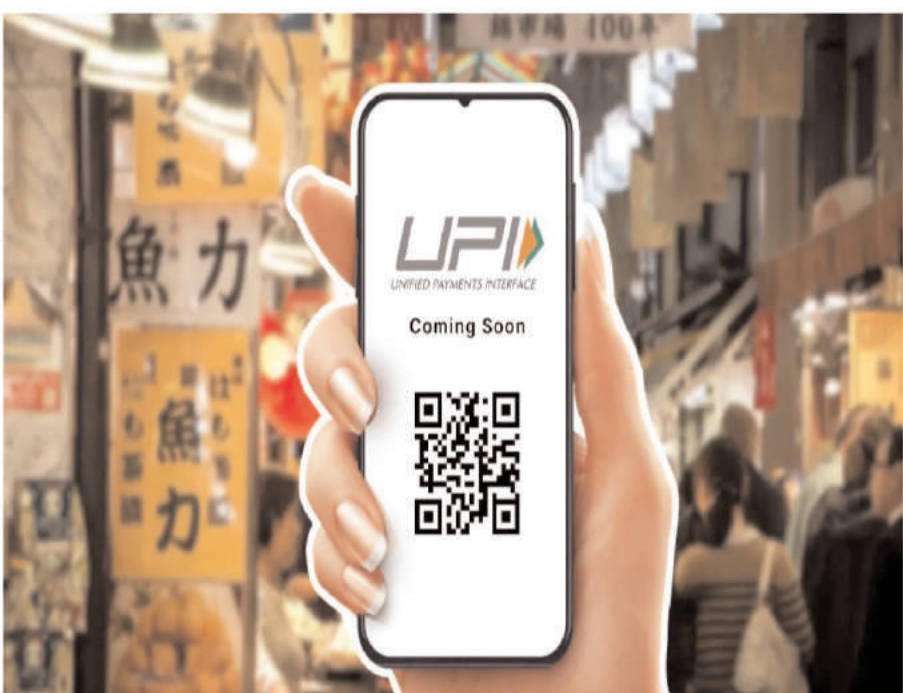
अर्थव्यवस्था को मजबूत करेगा। दूसरा बड़ा बदलाव वडकमें एक नया

इस निर्णय से बड़े मूल्य के कर भुगतान करने वाले करदाताओं को काफी सुविधा होगी। अब उन्हें एक ही लेनदेन में अधिक राशि का भुगतान करने की सुविधा मिलेगी। यह कदम डिजिटल भुगतान को और अधिक लोकप्रिय बनाने में मदद करेगा और देश में डिजिटल