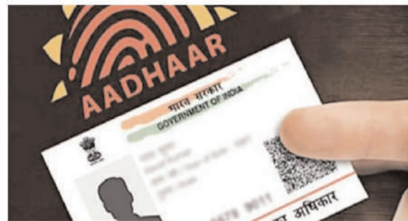
एक जरूरी दस्तावेज नहीं माना जाता है।

पासपोर्ट बनवाने के समय पासपोर्ट बनवाते समय आधार की खास जरूरत नहीं होती है। एड्रेस प्रूफ के तौर पर आधार कार्ड का इस्तेमाल नहीं किया जा सकता है। इसे एड्रेस के तौर पर