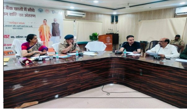
पट्टी अवश्य लगाएँ। उन्होंने संबंधित नगर पालिका परिषद एवं नगर

अमरोहा (सब का सपना):- जिला सड़क सुरक्षा समिति की बैठक गांधी सभागार कलेक्ट्रेट अमरोहा में जिलाधिकारी निधि गुप्ता वत्स की अध्यक्षता व पुलिस अधीक्षक अमित कुमार आनंद की उपस्थिति में संपन्न हुई। बैठक के दौरान हाईवे पर अवैध कट के कारण होने वाली दुर्घटनाओं पर नाराजगी व्यक्त करते हुए जिलाधिकारी निधि गुप्ता वत्स ने एनएच के अधिकारियों को अवैध कटों को तुरंत बंद करने के निर्देश दिए। जिलाधिकारी ने निर्देश दिए