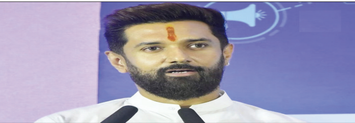
रामविलास पासवान का उत्तर प्रदेश में एक समय बड़ा आधार रहा है, जिसे फिर से संगठित कर पार्टी को एक मजबूत विकल्प के रूप में स्थापित किया जा सकता है। हालांकि चिराग भाजपा के भरोसेमंद सहयोगी हैं, लेकिन सभी 403 सीटों पर चुनाव लड़ने का बयान एक रणनीतिक संकेत माना जा रहा है। जनकारों का कहना है कि यदि भाजपा के साथ सीटों पर सम्मानजनक समझौता नहीं हुआ, तो पार्टी अकेले ही ताकत दिखाएगी। फिलहाल, संघटना में जिला स्तर पर तैयारियां शुरू कर दी हैं और आने वाले महीनों में राज्य के प्रमुख शहरों में बड़ी रैलियां के जरिए शक्ति प्रदर्शन करने की योजना बनाई गई है।

लखनऊ (एजेंसी)। बिहार की राजनीति के बाद अब लोक जनशक्ति पार्टी (रामविलास) के मुखिया और केंद्रीय मंत्री चिराग पासवान ने उत्तर प्रदेश की सियासी जमीन पर अपनी दावेदारी मजबूत कर दी है। पार्टी ने आगामी 2027 उत्तर प्रदेश विधानसभा चुनाव में राज्य की सभी 403 सीटों पर अकेले चुनाव लड़ने का औपचारिक ऐलान कर दिया है। इस फैसले ने उत्तर प्रदेश के राजनीतिक गलियारों में खलबली मचा दी है, क्योंकि चिराग की नजर अब यूपी के दलित और युवा वोट बैंक पर टिक गई है। लोकसभा चुनाव में 100 प्रतिशत स्टूडेंट रेट के साथ विचार में अपनी ताकत साबित करने वाले चिराग पासवान अब पार्टी के राष्ट्रीय विस्तार की योजना पर काम कर रहे हैं।