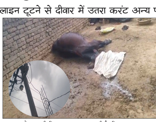
11000 वोल्ट्स की विद्युत लाइन