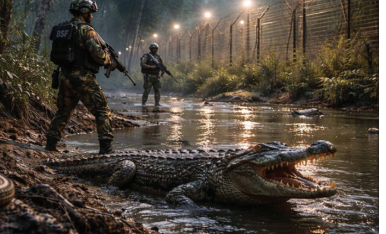
बीएसएफ अधिकारी मानते हैं कि सांप और मगरमच्छ तैनात करना आसान नहीं होगा। इनकी खरीद, रखरखाव, प्रजनन और स्थानीय पर्यावरण पर पड़ने वाले प्रभाव

लागू हूँ तो घुसपैठिए और तस्करों के लिए भारत में घुसने का ख्याल आते ही वह कंप जाएंगे। नदी के पानी में मगरमच्छ और घने जंगलों में जहरीले सांप हैज्जह सोचकर ही कोई भी गैरकानूनी तरीके से सीमा पार करने से पहले कई बार सोचेंगा। विशेषज्ञों का मानना है कि नदी वाले इलाकों में जहां फेंसिंग नहीं लगा पाती, वहां प्राकृतिक बाधाएं काफी प्रभावी साबित हो सकती हैं, लेकिन साथ ही यह भी चिंता जताई कि बाड़ के समय ये सरीसृप दोनों तरफ के गांवों के लिए खतरा बन सकते हैं।