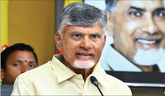
एक्स पर इस घटनाक्रम की पुष्टि करते हुए कहा कि आंध्र प्रदेश की राजधानी अमरावती है। इस तरह हैदराबाद को अस्थायी संयुक्त राजधानी बनाने की पिछली व्यवस्था को बदल दिया गया है। 28 मार्च को राज्य विधानसभा द्वारा अमरावती का समर्थन करने वाला प्रस्ताव पारित

अमरावती (एजेंसी)। सालों के इंतजार के बाद, अमरावती को आधिकारिक तौर पर आंध्र प्रदेश की राजधानी घोषित कर दिया है। 6 अप्रैल को अधिसूचना पर हस्ताक्षर किए गए, जिससे उस फैसले को कानूनी पुष्टि मिल गई जिसका इंतजार 2014 में राज्य के बंटवारे के बाद से किया जा रहा था। अधिसूचना के मुताबिक अमरावती को 2 जून, 2024 से पिछली तारीख से आधिकारिक राजधानी के रूप में मान्यता दी जाएगी। इससे शासन में निरंतरता सुनिश्चित होती है, साथ ही शहर को प्रशासन के केंद्र के रूप में चुनने के फैसले को कानूनी रूप भी मिलता है। इस घोषणा के साथ ही तेलंगाना के गठन और हैदराबाद के साथ संयुक्त राजधानी की व्यवस्था के बाद से चली आ रही 12 साल की अनिश्चितता का दौर औपचारिक रूप से समाप्त हो गया है।