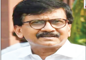
पीएम को यह बात समझ नहीं आ रही है और हमारी सरकार टूट के सामने झुक गई है।

मुंबई (एजेंसी)। शिवसेना (यूबीटी) सांसद संजय राउत ने पश्चिम बंगाल की सीएम ममता बनर्जी द्वारा पीएम मोदी के इस्तीफे की मांग का समर्थन करते हुए उन्हें शेरनी बताया। मंगलवार को मुंबई में राउत ने कहा कि ममता बनर्जी की मांग उचित है और आगामी पश्चिम बंगाल विधानसभा चुनावों में टीएमसी की सफलता पर विश्वास जताया। राउत ने कहा कि ममता ने पीएम मोदी के इस्तीफे की मांग की है। वह बंगाल की शेरनी हैं। बीजेपी बंगाल में कभी जीत नहीं पाएगी। इस चुनाव में भी आपको इसका नतीजा देखने को मिल जाएगा। बंगाल हमेशा उनके शासन में रहेगा।