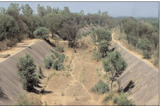
लक्ष्य रखा है। इसमें एसवाईएल नहर के माध्यम से 6,500 क्यूसेक और नरवाना ब्रांच के माध्यम से 3,500 क्यूसेक पानी उपलब्ध कराया जाएगा। यह पहली बार है जब नहरों का बड़े पैमाने पर जीर्णोद्धार किया जा रहा है।