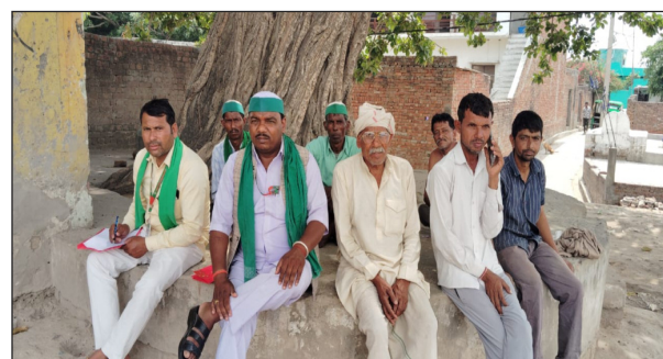
गौशाला भिजवाया जाए। डॉ. स्वामीनाथन की रिपोर्ट के अनुसार किसान आयोग का गठन किया जाए। गांव सिरसा एतमाली से लेकर