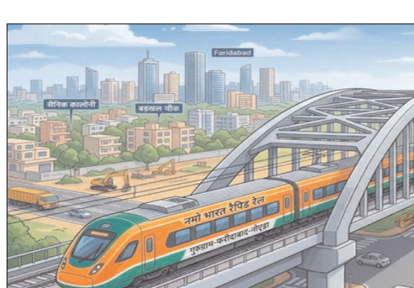
और सूरजपुर तक जाएगी। जिले में इस परियोजना की लागत करीब 3700 करोड़ आएगी। प्रस्तावित रूट के तहत सैनिक कॉलोनी से अनखीर

परियोजना विभाग के अधिकारियों संग बैठक करेंगे। उन्हें भी मौका मुआयना कराया जाएगा। इसके बाद यदि सब कुछ ठीक-ठाक रहा तो जुलाई या अगस्त में इस परियोजना के टेंडर किए जा सकते हैं। यानी इस बड़ी परियोजनाओं पर इसी साल काम शुरू करने की कवायद चल रही है। ताकि सीएम की अध्यक्षता में होने वाली प्राधिकरण की अगली बैठक में इस परियोजना को शुरू करने का प्रस्ताव लाया जा सके। दोनों परियोजनाएं हैं जरूरी नमो भारत रैपिड रेल परियोजना के तहत गुरुग्राम से फरीदाबाद होते हुए रैपिड रेल नोएडा के सेक्टर 142