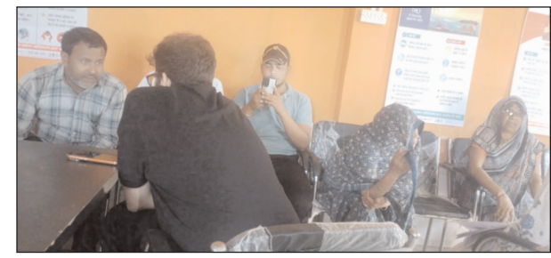
हाउसकीपिंग, इलेक्ट्रीशियन, दी जायेगी। जिसमें 12 हजार से 28 मैनुफैक्चरिंग हेलपर, आदि की नौकरी