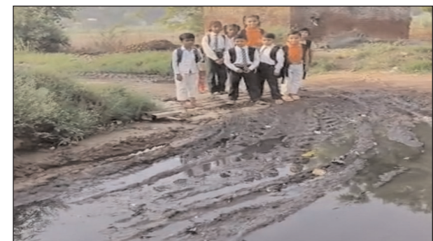
स्थिति के कारण न केवल बच्चों की ड्रेस और जूते खराब हो रहे हैं बल्कि आप दिन बच्चे इन रास्तों पर फिसल कर चोटिल भी हो रहे हैं। स्थानीय निवासियों का कहना है कि देश का भविष्य कहे जाने वाले ये बच्चे हर

शिकारपुर/बुलंदशहर (सब का सपना):- ग्रामीण विकास के सरकारी दावों और धरातल की हकीकत के बीच का अंतर तहसील क्षेत्र के ग्राम चित्तसौन में साफ देखा जा सकता है। गाँव में विकास की स्थिति इतनी बदतर है कि यहाँ के ग्रामीणों का जीना दुर्लभ हो गया है। आलम यह है कि गाँव की गलियों में गन्दगी का अम्बार लगा है और मुख्य रास्ते तालाब में तब्दील हो चुके हैं। सबसे हदयविदारक स्थिति स्कूल जाने वाले मासूम बच्चों की है। गाँव के मुख्य रास्तों पर घुटनों तक भरे गंदे पानी और फिसलन भरे कीचड़ के बीच से गुजरकर बच्चे स्कूल जाने को मजबूर है। इस नरकीय