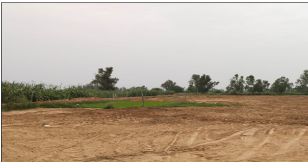
ढवारसी में एक और कृषि भूमि पर भराव डालकर प्लांटिंग करने की तैयारी

अमरोहा (सब का सपना):- जनपद के ग्रामीण क्षेत्रों में अवैध प्लांटिंग का कारोबार तेजी से पनप रहा है। ढवारसी, आदमपुर, रहरा और बुरावली में प्रांटी डीलर किसानों की कृषि भूमि को छोटे-छोटे टुकड़ों में काटकर बेच रहे हैं। भोली-भाली जनता को आवासीय जमीन बताकर झांसे में लिया जा रहा है। स्थानीय लोगों का आरोप है कि डीलर खेतों में मिट्टी डलवाकर कच्चे रास्ते बना देते हैं। नाली और बिजली के खंभे के नाम पर सिर्फ खानापूर्ति की जाती है। रजिस्ट्री में जमीन कृषि भूमि दर्ज होने के बाद भी ग्राहकों को आवासीय प्लॉट कहकर महंगे दामों पर बेचा जा रहा है। प्रांटी डीलर ग्रामीणों से कहते हैं कि आज नहीं लगे तो कल रेट दोगुना हो जाएगा ऐसा कहकर लोगों को फंसाया जाता है। न सीवर, न पानी, न पक्की सड़क की गारंटी दी जाती है। भविष्य