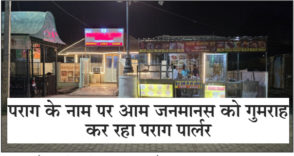
पराग के नाम पर आम जनमानस को गुमराह कर रहा पराग पार्लर

गजरोला/अमरोहा (सब का सपना):- सरकारी योजनाओं के तहत आम जनता को शुद्ध और गुणवत्तापूर्ण दुग्ध उत्पाद उपलब्ध कराने के उद्देश्य से पराग डेयरी ने उत्तर प्रदेश के विभिन्न जनपदों में पार्लर स्थापित किए हैं। इसी क्रम में जनपद अमरोहा के गजरोला में विकास खंड परिसर में पराग डेयरी को अपने उत्पादों की बिक्री के लिए 15७15 फीट की जगह आवंटित की गई है। अनुबंध के अनुसार इस पार्लर में केवल पराग डेयरी द्वारा निर्मित दूध, घी, पनीर, मक्खन, छाछ, लस्सी व अन्य दुग्ध उत्पादों की ही बिक्री की जानी है। इसका मुख्य उद्देश्य उपभोक्ताओं को मिलावट रहित उत्पाद उचित मूल्य पर उपलब्ध कराना है। लेकिन जमीनी हकीकत अनुबंध से अलग नजर आ रही है। गजरोला स्थित इस पराग पार्लर को अब होटल का रूप दे दिया गया है। पार्लर परिसर में कुर्सी-मेज लगाकर ग्राहकों को बैठाया जा रहा है। पराग के उत्पादों के साथ-साथ कढ़ाई, पनीर, दाल, मखनी, मलाई, चाप, छोले भरूरे, आलू पकोड़ा ब्रेड पकोड़ा व अन्य खाने-पीने का सामान खुलेआम बेचा